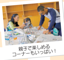
親子で楽しめるコーナーもいっぱい!