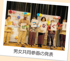
男女共同参画の発表