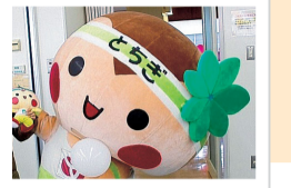
とちまるくんもやってくる!

今年のテーマは『変えよう! 変わろう! かがやく未来へ』と題し、女性の活躍推進や男性の地域・家庭への参画をすすめる企画が展覧されます。グループ・団体による楽しいワークショップ・展示・体験、雑貨や農産物の販売などが行われます。ご家族・お友達お誘い合わせの上、ぜひお越しください。(入場無料・申込不要)