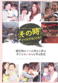
ママのための防災ブック